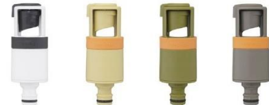
蛇口ニップル「ラクロック蛇口アダプター」

タカギでは、2020年度の散水用ホースリール「金属ガーデンリール」・蛇口一体型浄水器「LS」に続き、今年度は洗面用水栓「キレリスト」、ホースリール用加圧ユニット「RAKU JET」、蛇口ニップル「ラクロック蛇口アダプター」の3製品がグッドデザイン賞を受賞しました。