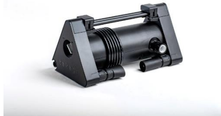
ホースリール用加圧ユニット「RAKU JET」